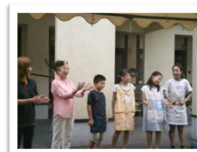
小学生がお手伝いに来てくれました。