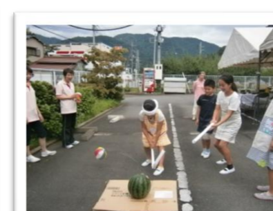
流しそうめんの後に、スイカ割りをしました。