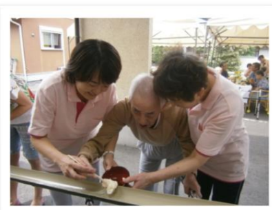
なかなか上手に擀うのが難しいです。

グループホームでは7月28日（木）に流しそうめんを行いました。今年は猛暑ということもあり、いつもよりも水の冷たさを感じました。皆さん家族と一緒に楽しいひと時を過ごされました。