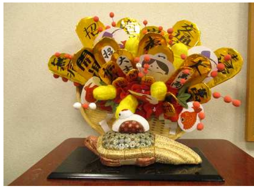
お正月飾りを作成しました