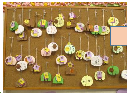
ご利用者様手作りの絵馬です

「立てば芍薬座れば牡丹歩く姿は百合の花」と思しい女性利用者の力作です。壁一面に美しく咲きました。今年も皆さんの笑顔の花が沢山見られるように・・・と願っています。