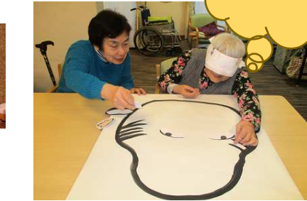
お正月名物福笑いを行いました(*'')