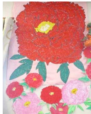
壁一面にちぎり絵を作成しました

「立てば芍薬座れば牡丹歩く姿は百合の花」と思しい女性利用者の力作です。壁一面に美しく咲きました。今年も皆さんの笑顔の花が沢山見られるように・・・と願っています。